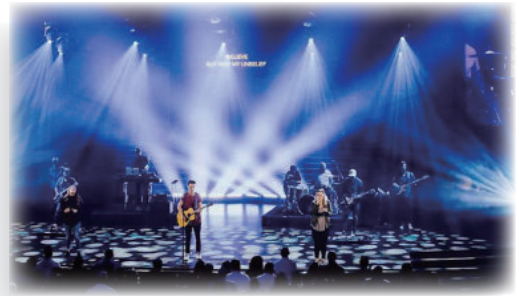
(圖三) 重經驗主義的教會

狂熱派及今日重經驗主義的教會是如何呢？聖台上沒有聖壇，不強調聖餐，有的甚至沒有講道台，樂器佔了聖台大部分的空間，甚至講台成了講道者的佈景（參圖三）。證道也是屬於個人分享，焦點多在講道者身上，而不在上帝聖道本身。相信聖靈會直接感動講員，使他可以領受新的啟示，有話可說。