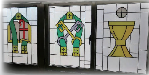
(圖五，圖六) 色彩與圖像 路德會 新竹聖道教會

路德會正確了解耶穌的身體，寶血是真實臨在聖餐中，而不是把耶穌重新獻給天父上帝，因此聖壇在最重要的位置。牧師著禮袍站於講道台後面宣講上帝的道，禮袍與講道台是牧師的遮蓋，使證道時聚焦於所宣講的道，而不是牧師個人。路德會重視聖道與聖餐，洗禮是一樣重要。教會的佈置使人一進入教會就清楚知道教會所注重的是什麼。上帝藉著洗禮賜下聖靈給我們，聖靈所賜給我們的信心使我們與基督連接在一起，使我們因基督為我們所做得稱為義。今日，上帝在教會使用牧師藉著聖道的宣講，聖禮的施行，我們得以領受這恩典。