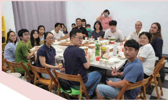
第一次恩光團契聚會