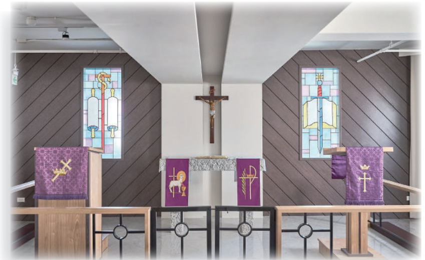
(圖四) 路德會 新竹聖道教會

那麼，路德會的教會佈置又是如何呢（參圖四）！圖像、色彩與圖畫的使用不是崇拜偶像，乃是幫助信徒記住與思考上帝的道並聚焦耶穌，宣講釘十字架的耶穌（參圖五，圖六）。聖壇仍維持在正中間的位置，聖台左右分別有講道台，讀經台，及教會入口洗禮台（參圖七）。