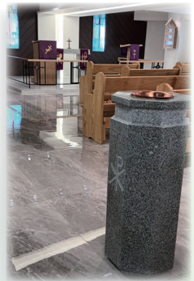
(圖七) 路德會 新竹聖道教會

路德會正確了解耶穌的身體，寶血是真實臨在聖餐中，而不是把耶穌重新獻給天父上帝，因此聖壇在最重要的位置。牧師著禮袍站於講道台後面宣講上帝的道，禮袍與講道台是牧師的遮蓋，使證道時聚焦於所宣講的道，而不是牧師個人。路德會重視聖道與聖餐，洗禮是一樣重要。教會的佈置使人一進入教會就清楚知道教會所注重的是什麼。上帝藉著洗禮賜下聖靈給我們，聖靈所賜給我們的信心使我們與基督連接在一起，使我們因基督為我們所做得稱為義。今日，上帝在教會使用牧師藉著聖道的宣講，聖禮的施行，我們得以領受這恩典。